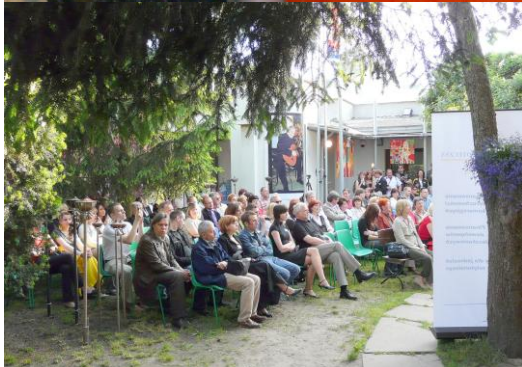
„Letni ogród sztuk” – projekt realizowany przez Stowarzyszenie „Skrzydłaci wśród nas” w Sulejówku