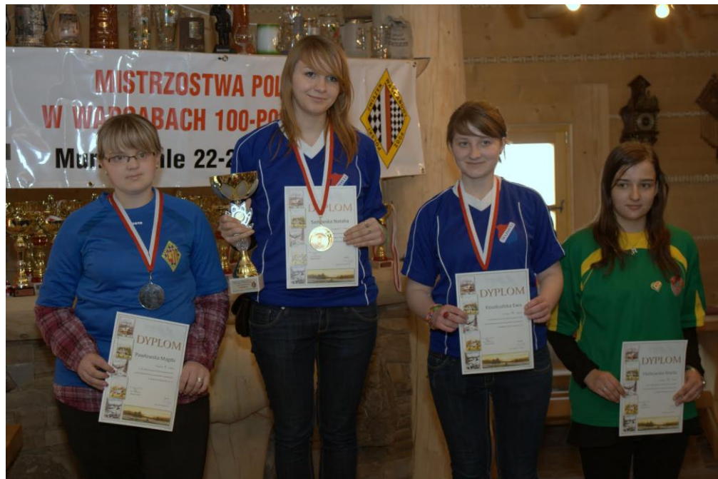
Zawodnicy z terenu Powiatu Mińskiego na Mistrzostwach Polski w Warcabach 100-polowych w Murzasichlu w 2009 r.