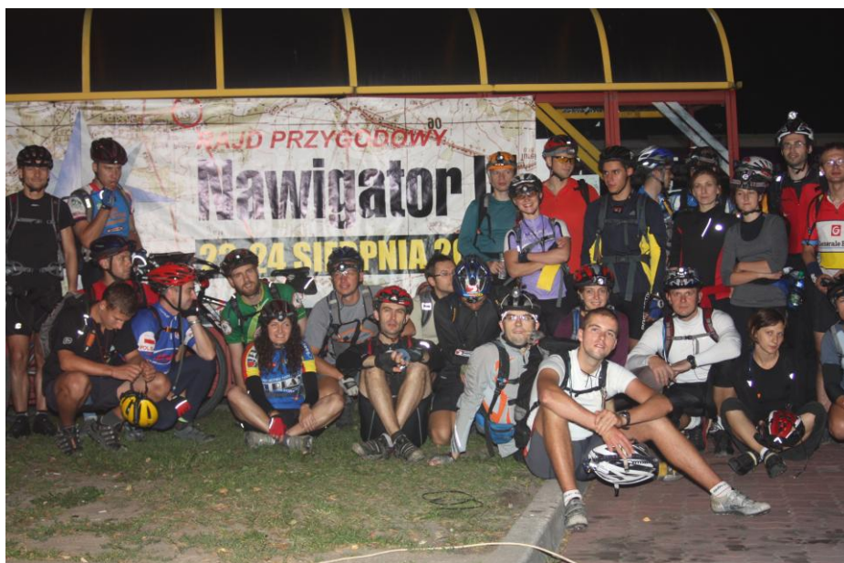
Raid przygodowy „Nawigator” zorganizowany przez Międzyszkolny Klub Sportowy „Korona”