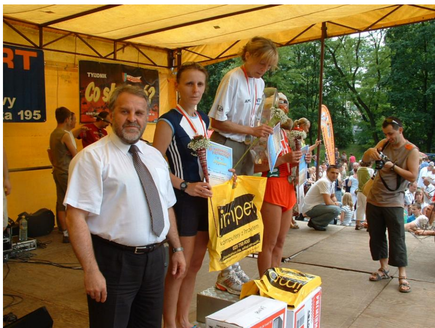
Wręczenie nagród zwycięzcom XII biegu ulicznego „Mazowiecka Piętnastka”