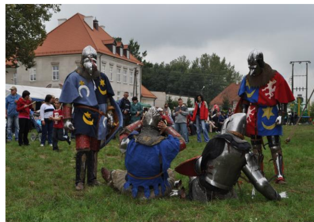
Powiatowe Spotkania Integracyjne Osób Niepełnosprawnych w roku 2008 i 2010