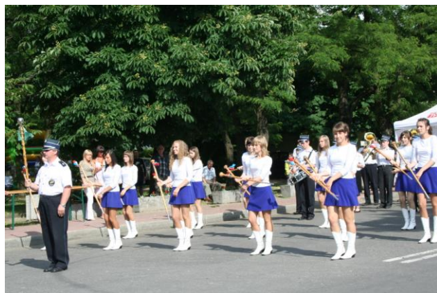
Przeegląd Młodzieżowych Orkiestr Dętych - projekt zrealizowany przez Stowarzyszenie „Orkiestra Dęta im. Jana Pawła II” w Kałuszynie w 2008 r.