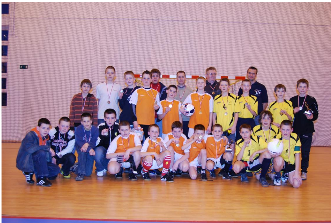
Rozgrywki w piłce nożnej – projekt Stowarzyszenia „Rozwijamy Talenty” w Długiej Kościelnej